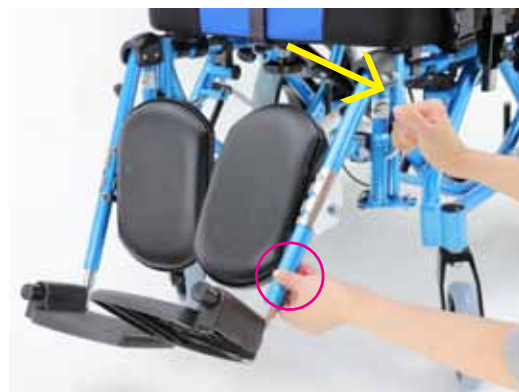
②フットレストは足を保持する為、レバーは固く設定されています。