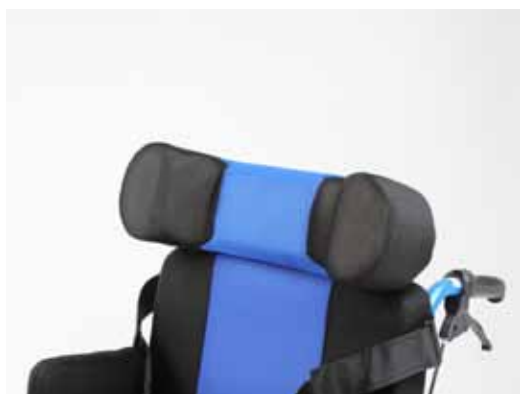
①ヘッドレスト最大