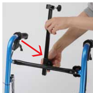
③ヘッドレストバーを取り付ける。(上げぎみに)