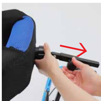
④ヘッドレスト本体を取り付ける。