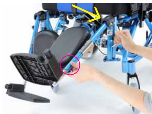
③9段階で設定が可能。最大でフットレストを水平にすることが可能です。ふくらはぎパッドは3段階で調整可能