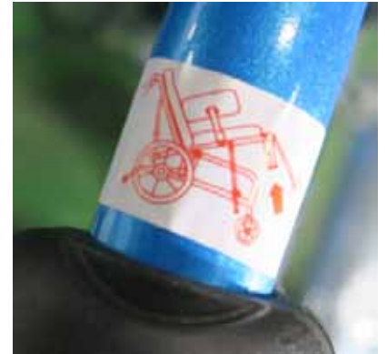
右レバー ティルト