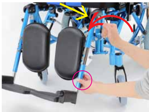
①レバーを倒しながら持ち上げる