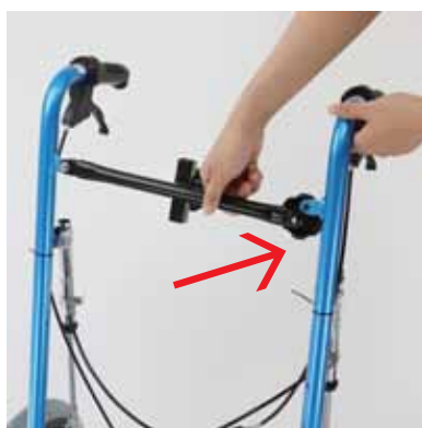
②背面補強バーを取り付ける