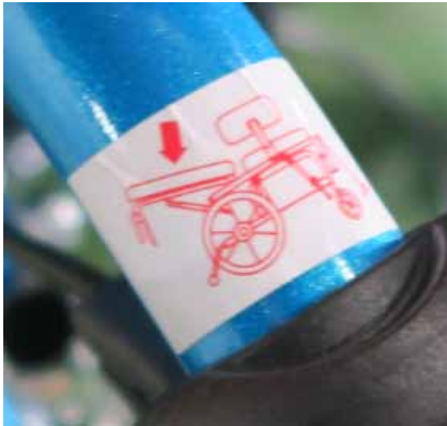
左レバー リクライニング