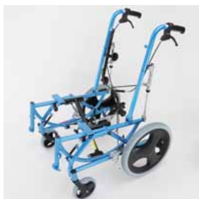
①フレームを広げる