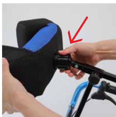
⑤ヘッドレストの角度調整はノブを回してください。左回りで緩み、右回りで締め付けになります。